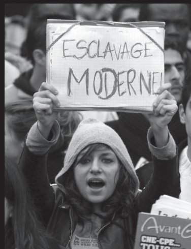
«Μοντέρνα σκλαβιά»: Μάρτης 2006, Γαλλία, Διαδηλώσεις CPE

5/4: Πραγματοποιούνται οι φοιτητικές εκλογές· η ερμηνεία των αποτελεσμάτων