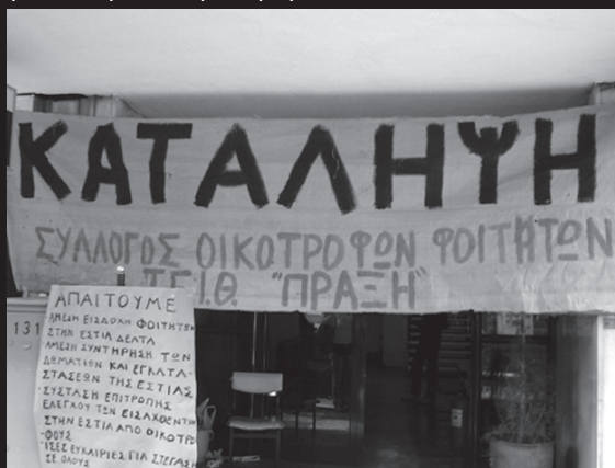
Στην φωτο η κατάληψη των εστιών το 2004. Το 2006 φοιτητές από την αυτόνομη - αντιεξουσιαστική τάση του κινήματος θα καταλάβουν τοςσες χώρο λύνοντας μόνιμα το στεγαστικό πρόβλημα για φοιτητές και μη.

23/11: Συλλαμβάνονται στα Τίρανα τρεις καθηγητές πανεπιστημίου μετά από διαδήλωση μπροστά στο πρωθυπουργικό μέγαρο. Οι καθηγητές του πανεπιστημίου των Τιράνων έχουν κατέβει σε απεργία εδώ και μια σχεδόν εβδομάδα με μισθολογικά και θεσμικά αιτήματα υπέρ της αυτονομίας των πανεπιστημίων. Την επόμενη μέρα, οι καθηγητές του πανεπιστημίου της Κορυτσάς προκηρύσσουν τριήμερη απεργία, ενώ καθηγητές και φοιτητές καταλαμβάνουν το πανεπιστήμιο της Σκόδρας.