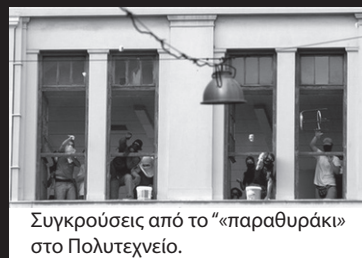
Συγκρούσεις από το «παραθυράκι» στο Πολυτεχνείο.