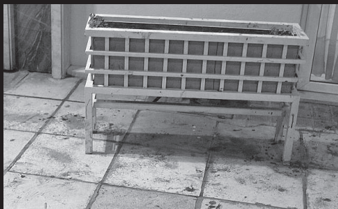
Η ζαρντινιέρα που σύμφωνα με την Αστυνομική Διεύθυνση Θεσσαλονίκης επιτέθηκε σε φοιτητή.

17/11: Όργιο κρατικής καταστολής εναντίον της νεολαίας που κατέβηκε στο δρόμο στις πορείες για την εξέγερση του Πολυτεχνείου. Το κλίμα είχε προετοιμαστεί τις προηγούμενες μέρες με εισαγγελική παρέμβαση που ζητούσε την άρση του ασύλου σε περίπτωση επεισοδίων. Στην Αθήνα, μπάτσοι επιτίθενται με κλομπς και δακρυγόνα εναντίον των αντιεξουσιαστικών/αναρχικών μπλοκ της διαδήλωσης, ξυλοκοπούν βάνουσα και συλλαμβάνουν διαδηλωτές. Στην πλατεία Μαβίλη, ο ίδιος κόσμος δέχεται επίθεση και από πληρωμένους από την ΠΑΣΠ τραμπούκους οπαδούς του Ολυμπιακού από τα Μανιάτικα. Στη Θεσσαλονίκη, ασφαλίτες προβοκάρουν πετώντας πέτρες στους μπάτσους με στόχο αυτοί να εισβάλλουν στο πανεπιστήμιο, κάτι που αποτρέπεται λόγω της παρουσίας φοιτητών και πανεπιστημιακών στο χώρο. Στην οδό Αγγελάκη, ασφαλίτες, παρουσία του αστυνομικού διευθυντή της Θεσσαλονίκης ξυλοκοπούν βάνουσα έναν διερχόμενο Κύπριο φοιτητή. Η δημοσιοποίηση του βίντεο με το περιστατικό προκαλεί κατακραυγή της αστυνομικής βίας.