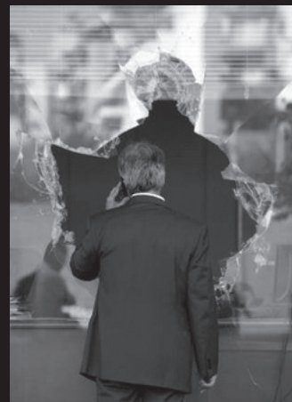
Αριστερά, αριστεροί φοιτητοπατέρες που φώναζαν "καμία συνδιαλλαγή" ποδοπατιούνται για να παραδώσουν τις αποφάσεις τους στο υπουργείο. Δεξιά, ένας γιάπης παρατηρεί μια σπασμένη τράπεζα στη Συγγρού.

15/6: Αθήνα: Πραγματοποιείται το μαζικότερο μέχρι τότε συλλαλητήριο στο κέντρο της Αθήνας, απάντηση στην πρωτοφανή κρατική καταστολή. Χιλιάδες κόσμου στα φοιτητικά μπλοκ, σε αρκετά από τα οποία είναι εμφανής η ύπαρξη αμυντικού εξοπλισμού: παλούκια, μάσκες και μαλόξ για τα δακρυγόνα. Η ΠΚΣ ξεκινά πάλι πρώτη και μόνη της. Καίγονται δυο κουτιά ηλεκτροδότησης καμερών. Σε μια κίνηση εκτόνωσης της έντασης από την πλευρά της κυβέρνησης και των φοιτητοπατέρων, συναντιούνται «εκπρόσωποι» των φοιτητών με τον υφυπουργό Παιδείας. Έπειτα, όπως είχαν προαποφασίσει ερήμην των φοι-