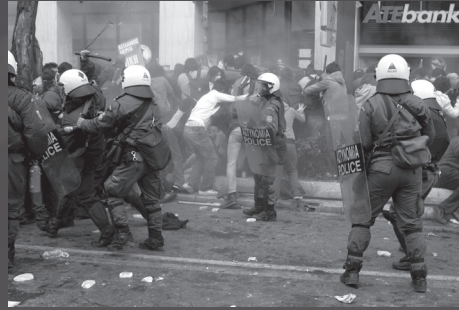
Επιθέσεις στα μπλοκ και μαζικές συλλήψεις από την πορεία της 8 Μάρτη

Σύρος: Νωρίς το μεσημέρι πραγματοποιείται πορεία και στο νησί της Σύρου, όπου φοιτητές-τριες αποκλείουν για λίγα λεπτά πλοίο της γραμμής μοιράζοντας φυλλάδια στους επιβάτες.