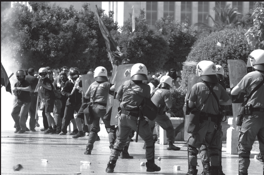
Δυναμικές αλυσίδες αποκρούουν την επίθεση των μπάτσων καθώς αυτοί επιχειρούν να διαλύσουν το φοιτητικό μπλοκ, παραβιάζοντας το άσυλο στα Προπύλαια.

ου, με σκοπό την επίθεση στις διμοιρίες του Υπουργείου Παιδείας. Καταλαβαίνοντας ότι ένα τέτοιο ενδεχόμενο θα ξέφευγε από τα συμβολικά πλαίσια που ήθελαν και θα χαλούσε το κλίμα εκτόνωσης που ήθελαν να λανσάρουν, οι φοιτητοπατέρες, αφήνουν έκθετο το συγκεκριμένο μπλοκ στους μπάτσους απομακρύνοντας τα μπλοκ που βρίσκονται από πίσω του. Οι διαδηλωτές στο μπλοκ του ΕΜΠ σχηματίζουν δυναμικές αλυσίδες, ενώ περικυκλώνονται από πολλές διμοιρίες στην Πανεπιστημίου. Στα Προπύλαια, οι μπάτσοι επιχειρούν για άλλη μια φορά να ανέβουν στο άσυλο, αλλά αποκρούονται από τις αλυσίδες δεχόμενοι αρκετές πέτρες. Ενώ εκτοξεύονται χημικά προς το μέρος του, το μπλοκ δε διαλύεται όπως συνήθως. Οι εσακίτες οδηγούν την πορεία στη Νομική για να γλιτώσουν τις συγκρούσεις γύρω από το Πολυτεχνείο στην Πατησίων. Τα ΜΑΤ επιτίθενται βάρβαρα στον κόσμο που στριμώχνεται στις στενές εισόδους του κτιρίου, ενώ απ' έξω στήνονται οδοφράγματα που τους απωθούν. Συλλαμβάνεται και ξυλοκοπείται μια φοιτήτρια, ενώ ξύλο τρώνε κι αρκετοί δημοσιογράφοι και φωτορεπόρτερ που καταγράφουν το γεγονός. Ο κόσμος μέσα στη Νομική είναι σε άσχημη κατάσταση από τα χημικά και τη ζέστη, ενώ πέφτει ξύλο μεταξύ αναρχικών διαδηλωτών κι εσακικών σχετικά με το αν θα ανοίξει η πόρτα για την τάρτα της σχολής, έτσι ώστε να γίνει και από εκεί επίθεση στα ΜΑΤ. Μετά από λίγες ώρες ο κόσμος αποχωρεί προς τα Προπύλαια.