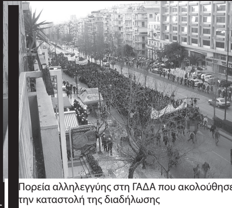
Πορεία αλληλεγγύης στη ΓΑΔΑ που ακολούθησε την καταστολή της διαδήλωσης

4/3: Πραγματοποιείται συντονιστικό καταλήψεων στη Θεσσαλονίκη. Αν και ανένταχτος κόσμος μαζί με καταλήψεις που δεν είναι κομματικά ελεγχόμενες 68 προτείνουν μια σειρά δράσεις για να αναζωπυρωθεί το κίνημα ενόψει της ψήφισής του νόμου-πλαίσιο, οι φοιτητοπατέρες των ΕΑΑΚ και της ΠΚΣ μαλώνουν για άλλη μια φορά